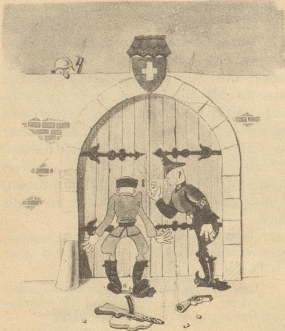
Da gits kes Herein!