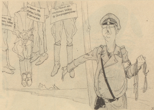
„Wir haben die Herrschaft in der Luft.“