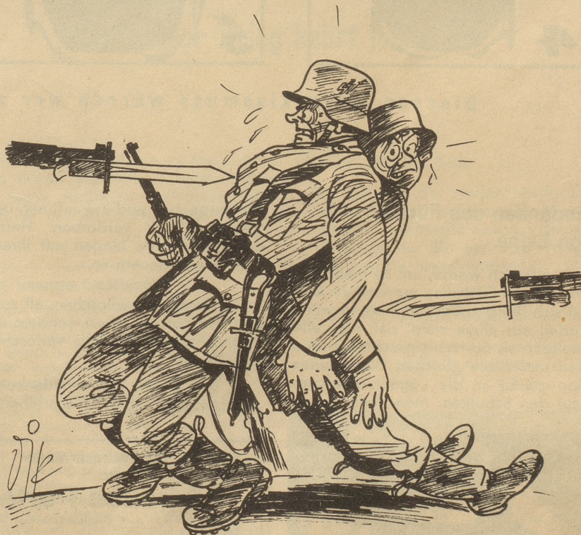
S. o. S.

Man spricht gerne von einem «Saubern Burschen», wobei das Wort «sauber» gerade das Gegenteil seines ursprünglichen Sinns bedeutet. Hamei