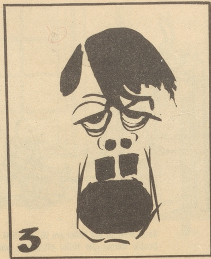
Firrzehn Jahrä lang hat er ihr das Mark ausgezogen!