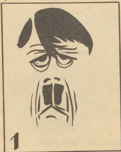
Gennosen onn Gennosinen!