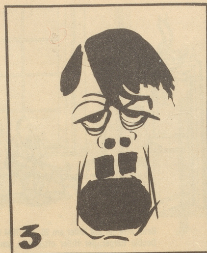
Firrzehn Jahrä lang hat er ihr das Mark ausgezogen!