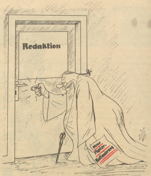
En wüeschte Bsuech!