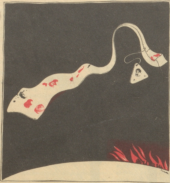
Lavals „weiße“ Krawatte wollte sich davonschlängeln