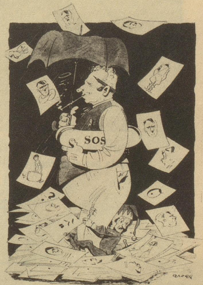
Die Bildredaktion im Mai 1945

Gott motivierte dies folgendermaßen: Wenn einer klug ist, und doch Na- tionalsozialist, dann kann er nicht ehrlich sein, ist er aber ehrlich und National- sozialist, dann vermag er nicht gleich- zeitig klug zu sein, ist er aber ehrlich und klug dazu, dan ist er bestimmt kein Nationalsozialist. Th. K.