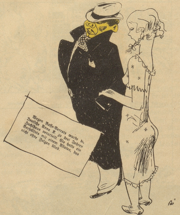
Zum Bündnis Deutschland-Japan