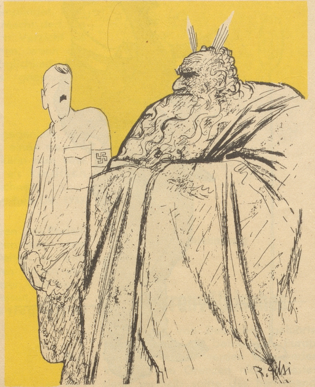
Interview beim bösen Feind

«Wie haben Sie eigentlich seinerzeit Wasser aus dem Stein gezaubert, Herr Moses? Kann man das nicht auch mit dem Brot machen, das ich meinen Wählern versprochen habe?»