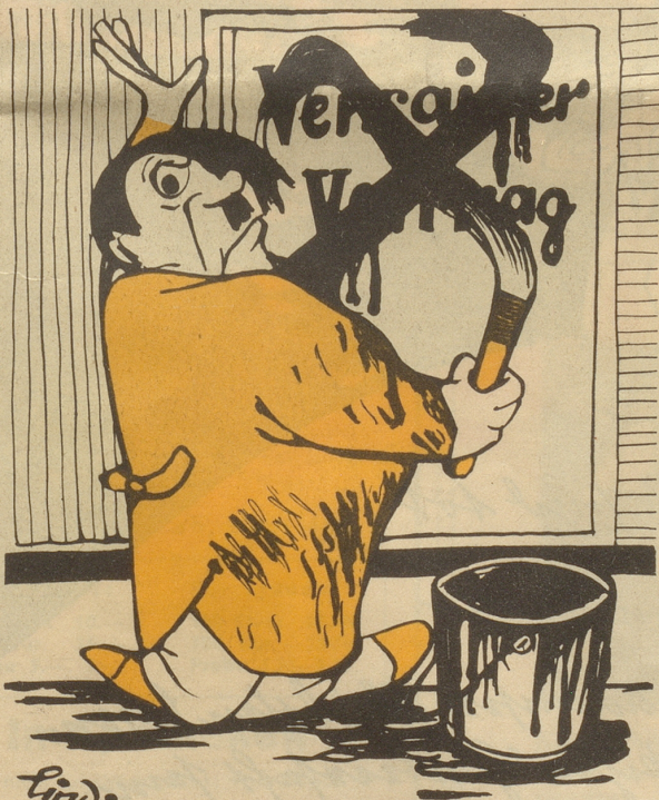
Adolf streicht den Versailler-Vertrag Adolf streicht weiter...