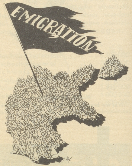
Das andere Deutschland