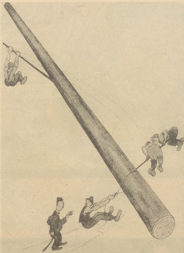
«Warum saged er en nüd abenand!» «Das git drum es Zahbürschfeli — aber de Näbelspalter-Redakter hät mir verbotte z'säge für wen!»