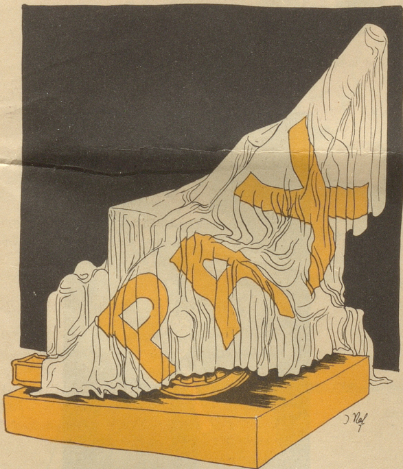
Der Friede von München!

«— also schließen wir mit ihm einen Nichtangriffspakt ab!»