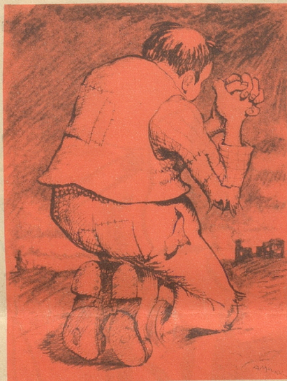
Das Friedensgebet des hl. Franz von Assisi

So tönte es im Frontenfrühling, aber die Hirtenknaben lie;en sich nicht einschüchtern. Inzwischen aber hat das 20. Jahrhundert den Nationalsozialismus und den Faschismus in die Schranken gewiesen. EKZ.