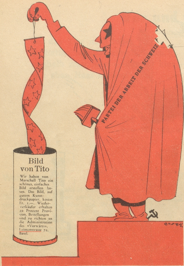
„Vorwärts! Wer kriecht auf den Leim der Leimenstrasse?“