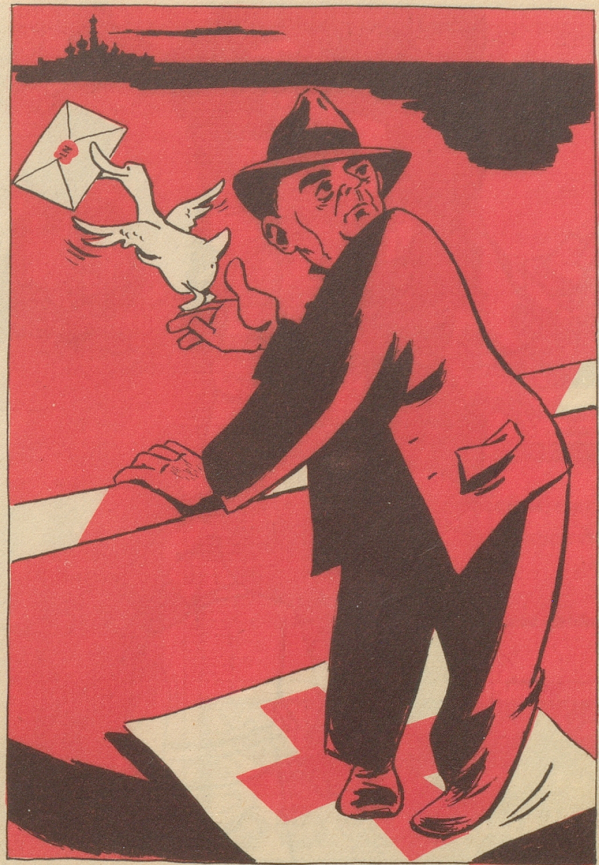
Nicole schickt seine Brieftauben nach Moskau