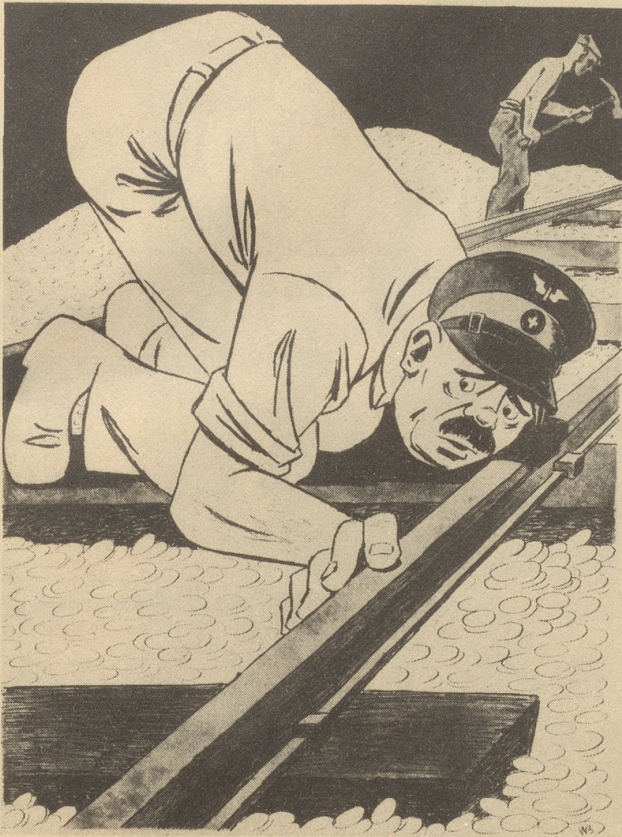
Neue Erhöhung der Bahntaxen in Sicht.

„s hät sich e chli gsänkt, me sött wieder e paar Garette voll underegrampe.“