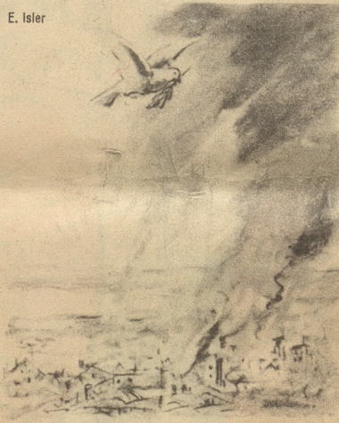
Achtung Achtung — die Luftlage!

Schweinsblasen. Haben die Buben mal einen Federkiel in eine Blase gebracht, blasen sie, soviel sie Blast haben, und aus einem kleinen Ding wird ein gewaltig großes, daß man meinte, was es wäre. Die Agenten haben es mit den Parteien akkurat wie die Engländer mit Hahnen, welche miteinander kämpfen und bedeutende Wetten entscheiden sollen. Jeder Agent stärkt, steift seine Partei, bläst ihr den Kamm in die Höhe, kämmt ihr die Schwanzfedern, schnei-