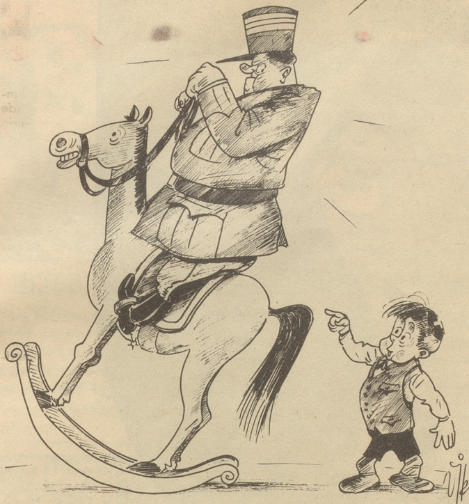
An die, die es angeht „Dir chöit etz wider abechoo!“