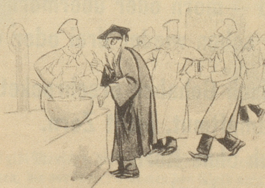
Der Englischprofessor überwacht die Zubereitung der Buchstaben-Suppe. Life

gefühl, auf diese stramme Art, wie wir HD eben grüssen, geehrt zu werden, leicht neidisch. Auch HD haben gute Gedanken und weitreichende Beziehungen. Es gelingt uns, einen Uniformrock mit den Gradabzeichen eines Obersten zu beschaffen. Der imposan-