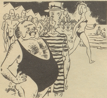
«Merkwürdig ... jedesmal, bevor sie sich auskleidet und zu Bette geht, verlangt sie, daß ich das Licht auslösche.» «Le Rire»