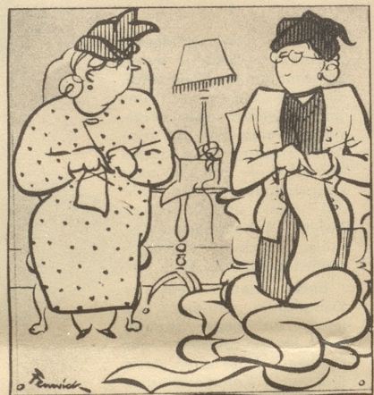
„Es schaudert mich beim Gedanken, daß ich diesen Strumpf wieder aufziehen muß.“ Illustrated

Ich glaube, von jetzt an laß ich die weißen Fäden im Haar ... Valérie.