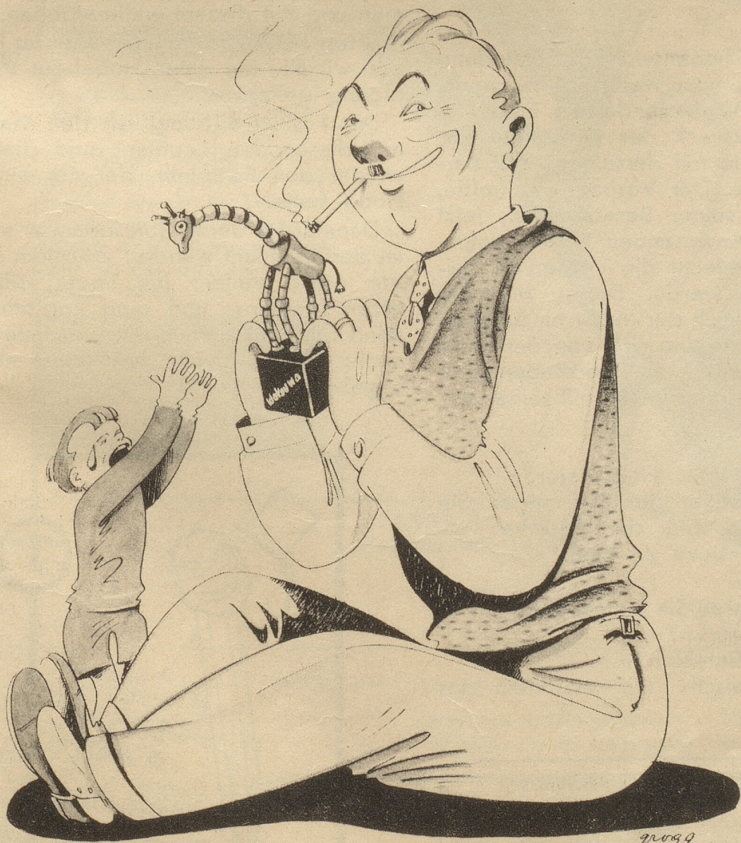
„Wakouwa“, die geniale Schweizer Erfindung

(Dieser wohlmeinende Rat stammt wahr-scheinlich von einem Koch, der es mit einem lebenden versucht hat.) R.