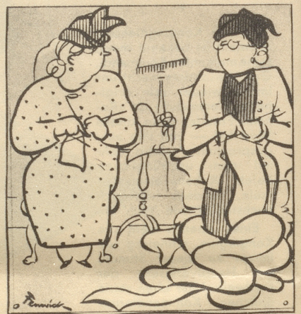
„Es schaudert mich beim Gedanken, daß ich diesen Strumpf wieder aufziehen muß.“ Illustrated