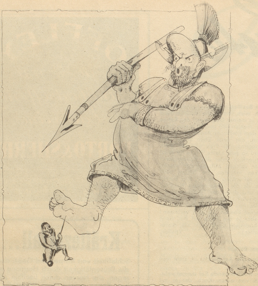
Mars und der Partisan