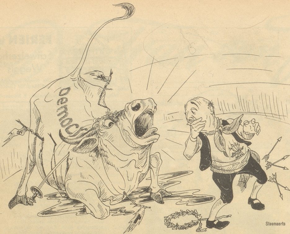
FRANCO: „Caramba, ich hatte ihn doch getötet!“