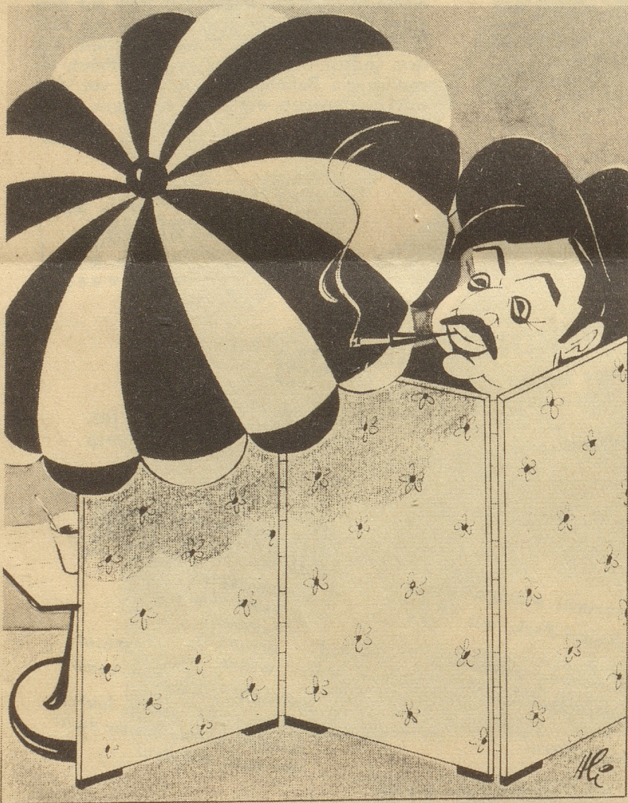
Die spanische Wand