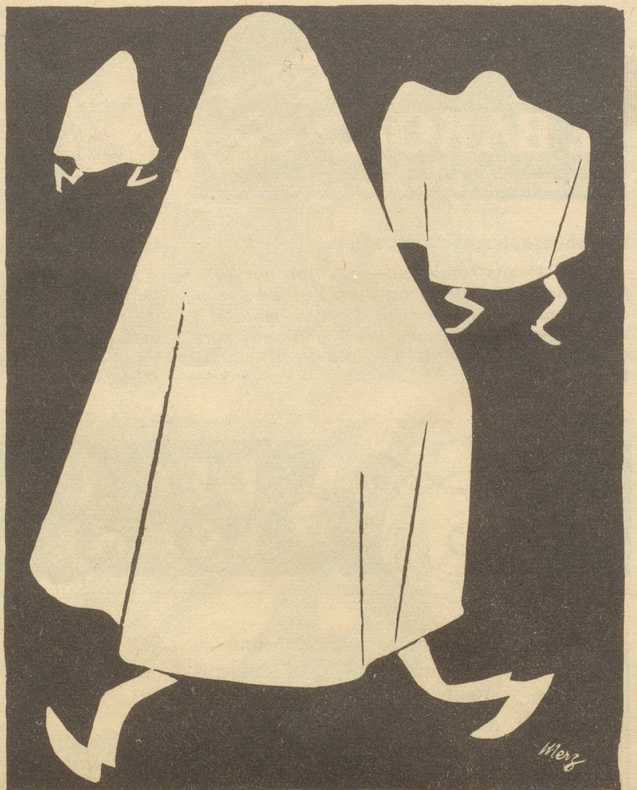
Im Verlauf der Useputzete Weißes Tuch sehr gefragt