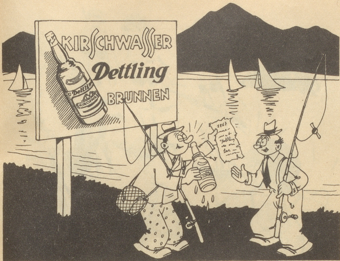
Ein guter Fang ... ein prima Tropfen!

BILDER? Originale unerschwinglich? Dann Meisterdrucke aus dem WOLFSBERG Zürich 2, Bederstr. 109