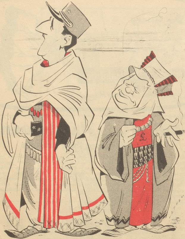
Es wird auch hier nicht fraternisiert!