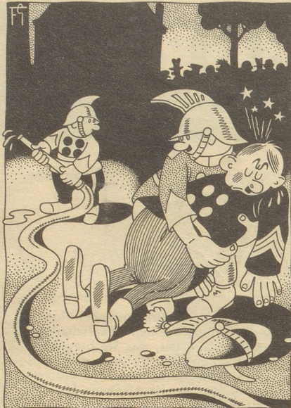
«De Hauptme hät gmeint, es sig e Schlange!»