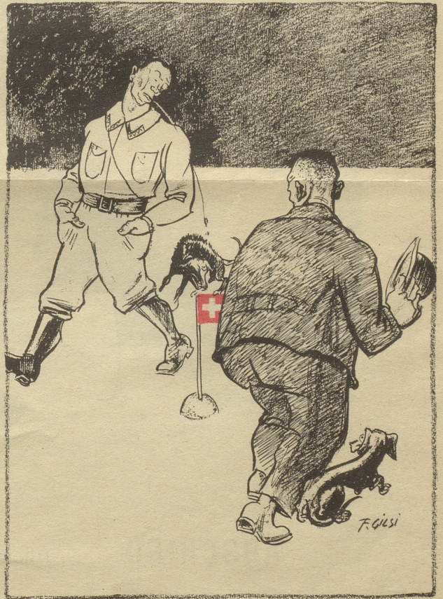
Nazi — einst und jetzt