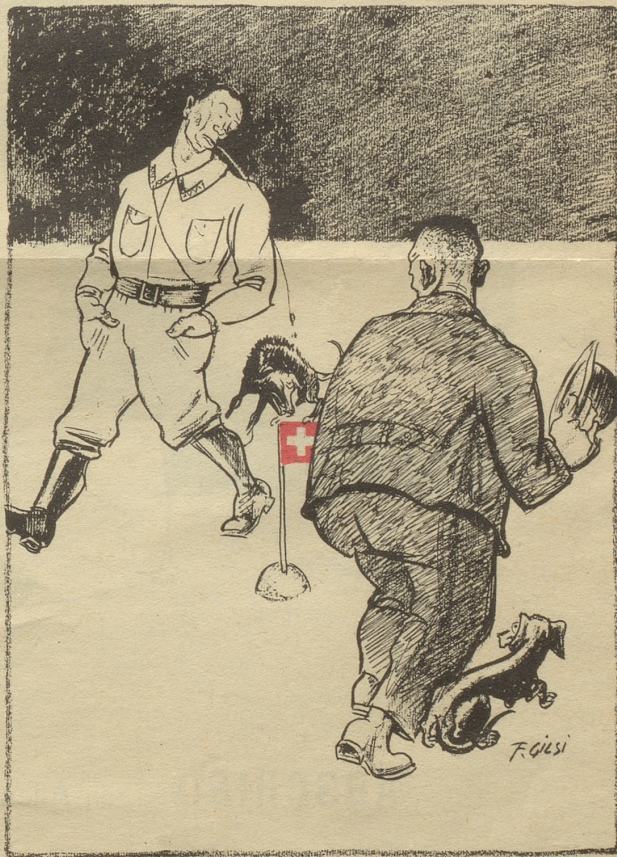
Nazi — einst und jetzt