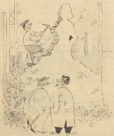
«Er wollte einmal Bildhauer werden!» Söndagsnisse-Strix

Bei den Wettkämpfen der Männerturner wünscht unter den Zaungästen ein neugieriges Mädchen Auskunft: «Du, Mäme, weles sind jetz die Hundertjährige?» F. G. M.