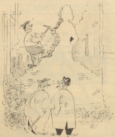
«Er wollte einmal Bildhauer werden!» Söndagsnisse-Strix

«Du, Mäme, weles sind jetz die Hundertjährige?» F. G. M.