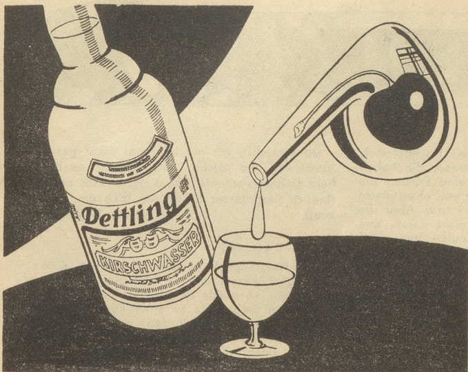
Ein edler Tropfen ... Kirsch Dettling!

Für Fr. 145.- eine vollwertige Rechenmaschine Schweizer Präzisions-Produkt Prospekt oder Vorführung vom Fachmann, Büromaschinen E. Friedli Zürich Postfach H. B. 2384