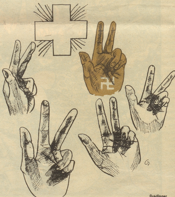
Und die Schweizer Nazi — — ?

Ich chönnt jetzt wänn i wett und wänn i nöd sälber druf sitze würd!