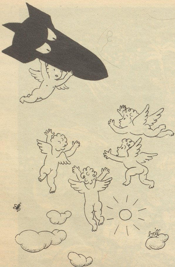
Die Atombombe wird solange dem Frieden dienen, als man sie nicht fallen läßt!