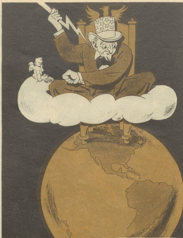
Zeus der Jüngere

Ich chönnt jetzt wänn i wett und wänn i nöd sälber druf sitze würd!