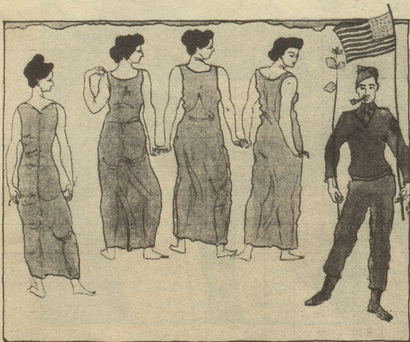
Jüngling, vom Weibe bewundert frei nach Hodler