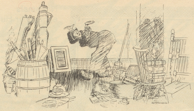
Wo und wenn isch mr denn 's Klavier abegschlipft?