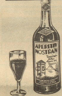
Tessiner Spezialität der Firma SAPI LUGANO