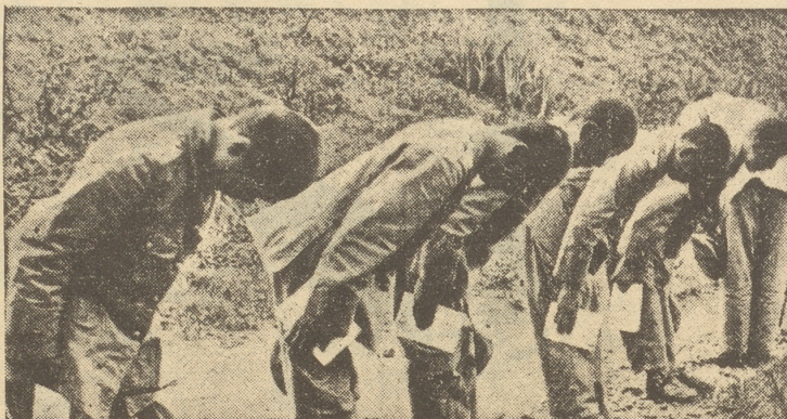
Zöglinge einer Militärschule verbeugen sich jeden Morgen vor Beginn des Dienstes in der Richtung des kaiserlichen Palastes ...

Der «Rechtsaußen» hat sich in der Richtung geirrt oder er ist böse mit dem Kaiser!