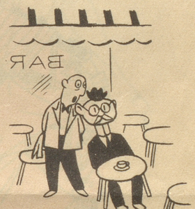
Savons, Chocolats, Cigarettes de Paris.