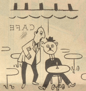
Savons, Chocolats, Cigarettes Américains.