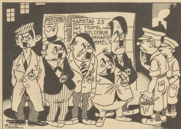
Immer noch alliierte Suche nach Hitler!