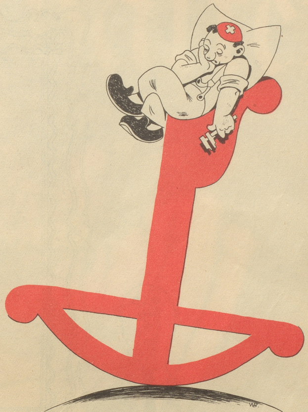
Unsere Industrie muß noch leistungsfähiger werden, Qualität allein genügt nicht mehr!