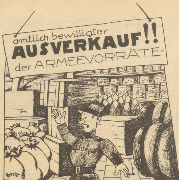
Eine sympathische Liquidation!