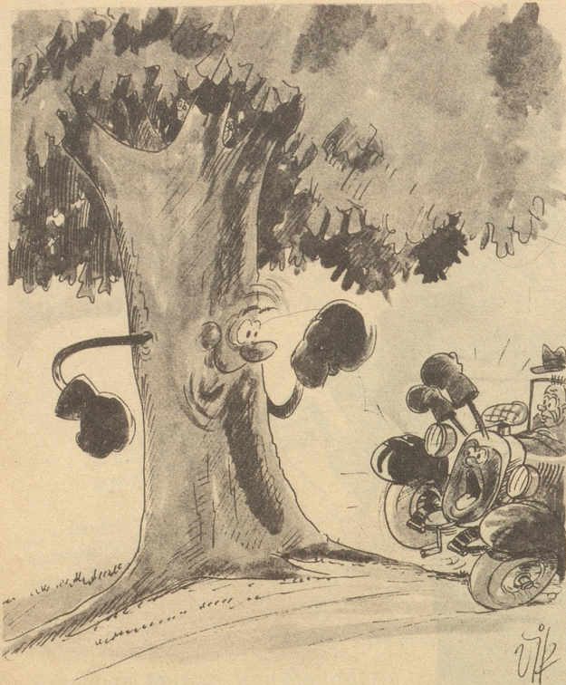
Es wird wieder trainiert!