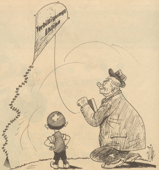
Das ist die schöne Zeit der Drachen, Die Väter ihren Kindern machen!