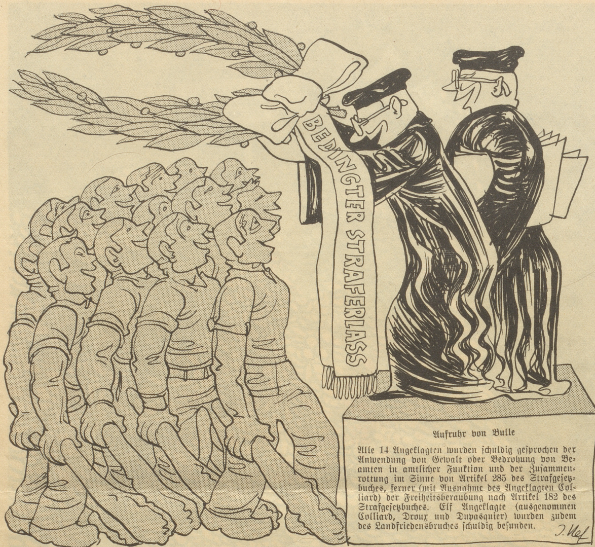
Aufruhr von Bulle

Alle 14 Angeklagten wurden schuldig gesprochen der Anwendung von Gewalt oder Bedrohung von Beamten in amtlicher Funktion und der Zusammenrottung im Sinne von Artikel 285 des Strafgesetzbuches, ferner (mit Ausnahme des Angeklagten Colliard) der Freiheitsberaubung nach Artikel 182 des Strafgesetzbuches. Elf Angeklagte (ausgenommen Colliard, Droux und Dupasquier) wurden zudem des Landfriedensbruches schuldig befunden.