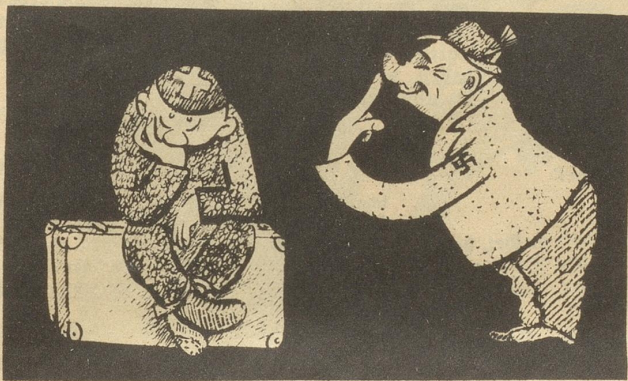
Ich darf nid furt

Du wotsch doch hoffelich nöd 's Läbe lang Schtiff bliibe und di ummekommandiere losse! Das wär ja de Gipfel. Chrampfe, Göpfi, chrampfe, damit de au-n-emol Patron wirsch und 's schön hesch! Babett