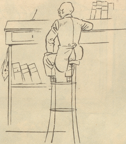
Unsere Väter im Büro