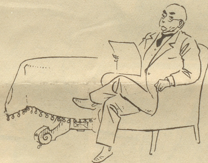
Unsere Väter in ihrer freien Zeit