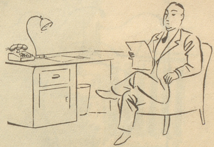
Wir im Büro