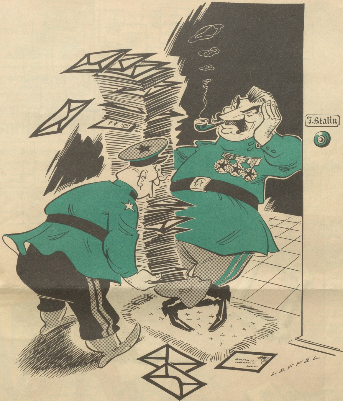
Stalin wurde als krank bezeichnet, einige Journalisten verbreiteten Meldungen über sein Ableben.