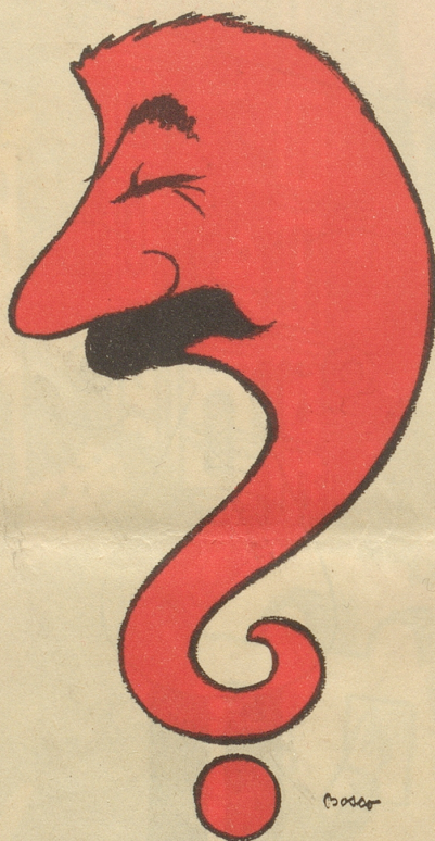
Das rote Fragezeichen

Nach einem noch unbestätigten Gerücht soll sich auch Winston Churchill in der Schweiz aufhalten. Jedenfalls glaubt man den einstigen Premier in