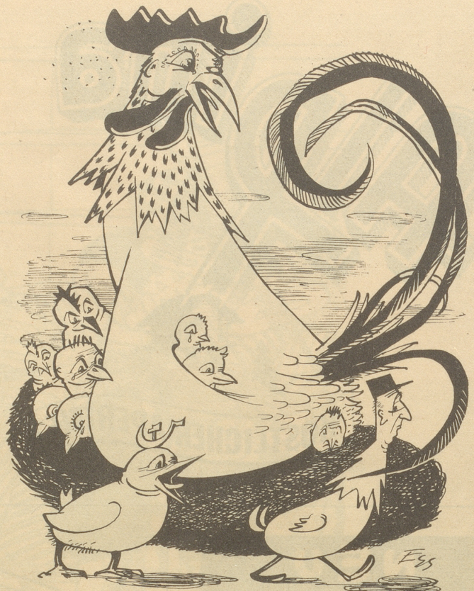
Krise in Frankreich

«Lueg was dr de Chlaus bringt! Wie seischt!»