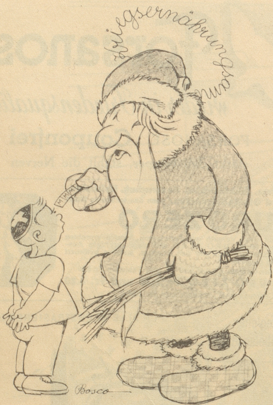
Das Kriegsernährungsamt schenkt uns auf die Festzeit vier Mahlzeitencoupons.

«Lueg was dr de Chlaus bringt! Wie seischt!»