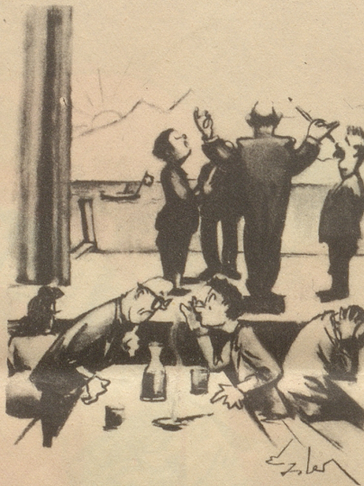
Eidg. Wahlen vom 25. November 1945 Stimmbeteiligung 53%, also relativ gut!

Aus «Doktor Dorbach, der Wühler und die Bürglenherren in der Weihnachtsnacht anno 1847.» E.