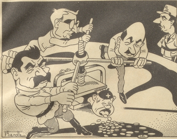
Die Alliierten, das deutsche Geld und wir