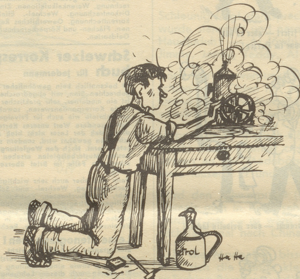
... Immer heftiger gab ich dem Schwungrad an ...

Wieder landete ich in meinem ersten Geschäft. Diesmal lief ich mir die 65-fränkige