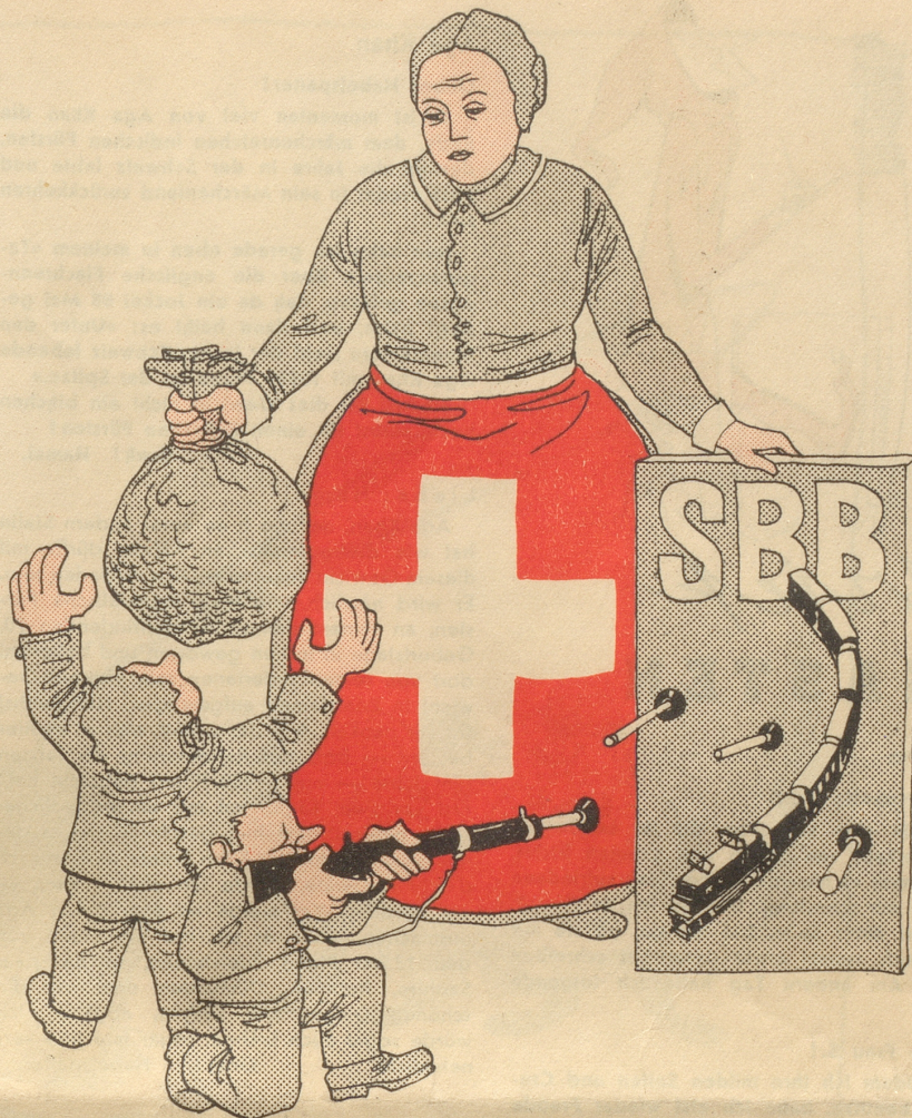
Das Schwyzervolk hatte am 21. Januar auch über die Sanierung seiner Südostbahn abzustimmen, die nur mit der vom Bund gewährten Privatbahnhilfe möglich ist. Die Ostbahnvorlage wurde angenommen, das Bundesbahngesetz bachab geschickt.