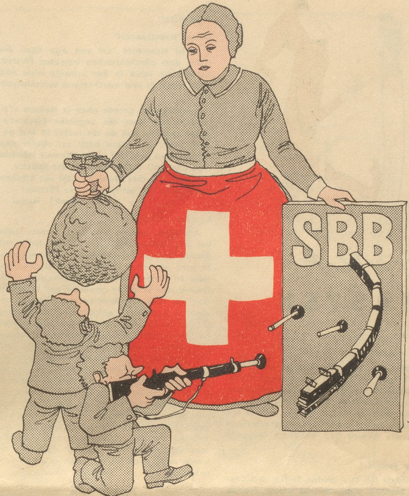
Das Schwyzervolk hatte am 21. Januar auch über die Sanierung seiner Südostbahn abzustimmen, die nur mit der vom Bund gewährten Privatbahnhilfe möglich ist. Die Ostbahnvorlage wurde angenommen, das Bundesbahngesetz bachab geschickt.